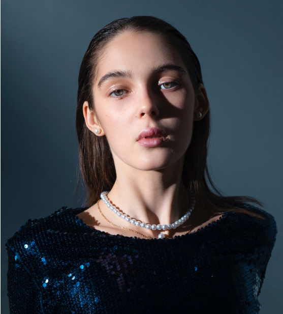
CLOTHES BY VICK EASTLY, SPRING SUMMER 2025.